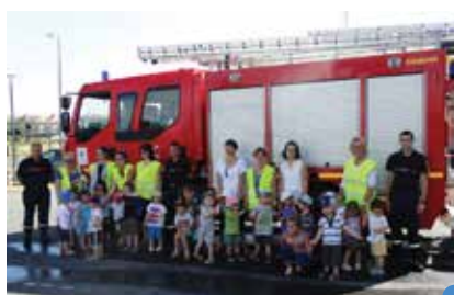
à la caserne des pompiers