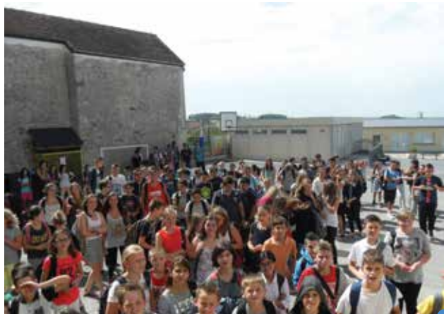
la rentrée des élèves