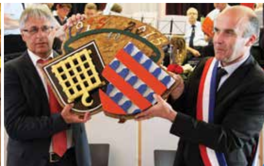
festivités à Wald Michelbach pour le 40 e anniversaire du jumelage