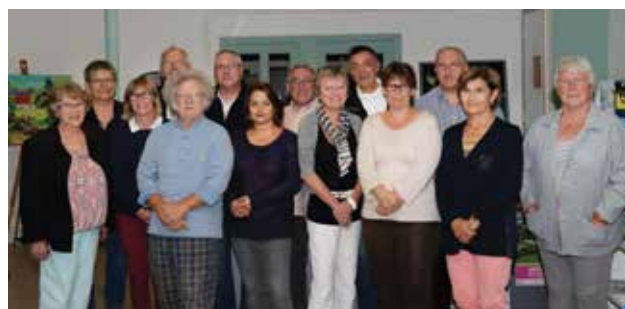
lors du Conseil d'Administration 2015

La commission produit de terroir a organisé sa grande manifestation intitulée « Journée Nature et Terroir » le dimanche 4 octobre au quartier de la gare. Quatorze producteurs et artisans locaux ont répondu présents au milieu des quatre grandes expositions, de champignons avec SMCTO, de trains miniatures avec TMO, des mues et des insectes. Le troc aux plantes d'automne et les animations ludiques ont remporté un franc succès. Tous à vos agendas : prochaine « Journée Nature et Terroir » en octobre 2017 !