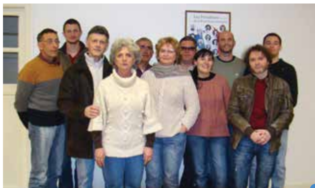
les membres du Conseil Municipal