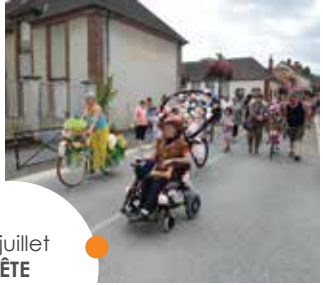
14 juillet FÊTE NATIONALE