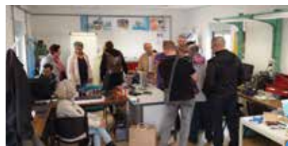
le Fab'Lab café Axon'