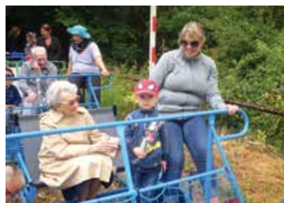
balade en vélo-rail

La MAISON DE RETRAITE DE NAZARETH et la crèche LES P'TITES HIRONDELLES se sont retrouvées une fois par mois dans l'une des structures autour d'animations diverses (activité pâte à sel, goûter de la galette des rois, chansons,...). Pour conclure l'année, une sortie a été organisée avec ces deux générations le mardi 23 juin à Joiselle, pour une balade en vélo-rail. Les enfants (les plus grands de la crèche) et les résidents ont pu partager ensemble un moment agréable dans la joie et la bonne humeur accompagnés par le personnel de ces deux structures. Après tant d'efforts, ils ont fini cette matinée par un pique-nique. Cette sortie était une première et sera sûrement reconduite car l'échange fut très positif.