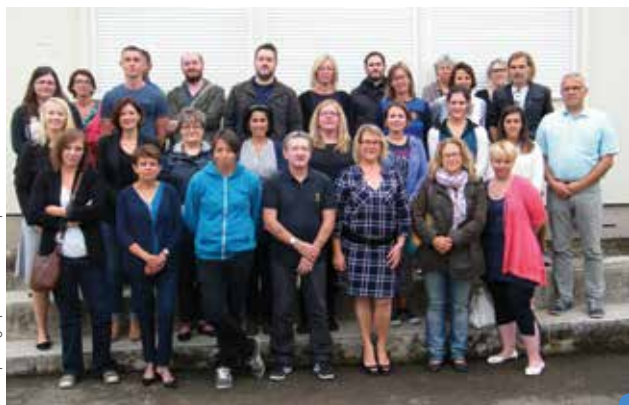
la rentrée des enseignants