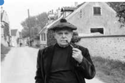
CAUSERIE-CONFÉRENCE MAC ORLAN