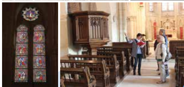
l'église de Rieux, son chœur, ses vitraux