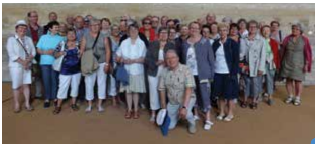
présentation de dressage, le Club Joie de Vivre à Chantilly