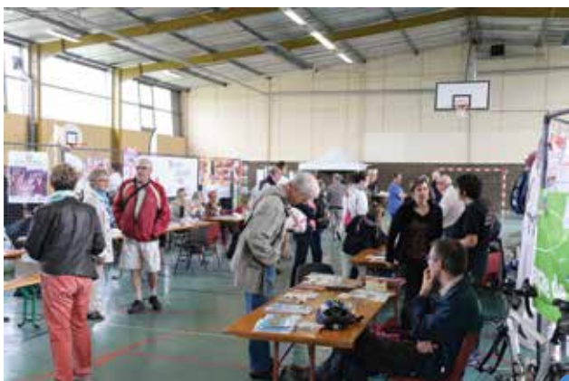
forum des associations 2015

Ce forum sera reconduit l'an prochain avec, nous l'espérons, plus d'associations encore pour que chacun y trouve l'activité qu'il souhaite. En attendant le prochain forum, il est encore possible de s'inscrire auprès des différents responsables.