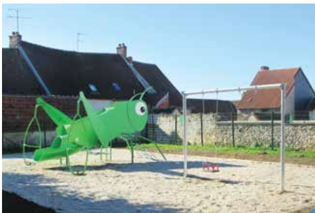
sauterelle-toboggan-tournoquet et balançoire

Le coût d'achat de ces jeux s'élève à 17 950 € HT. La préparation du terrain ainsi que le montage est effectué par le service technique de la ville.