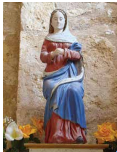
la statue de Sainte-Eulalie

permanence mercredi de 14h à 16h et samedi de 10h à 11h30