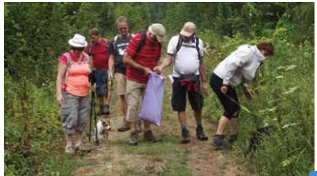
le 9 août à Bruyères-sur-Fère

Retrouvez le programme complet des randonnées dans l'agenda, sur notre site ou au SIMR.