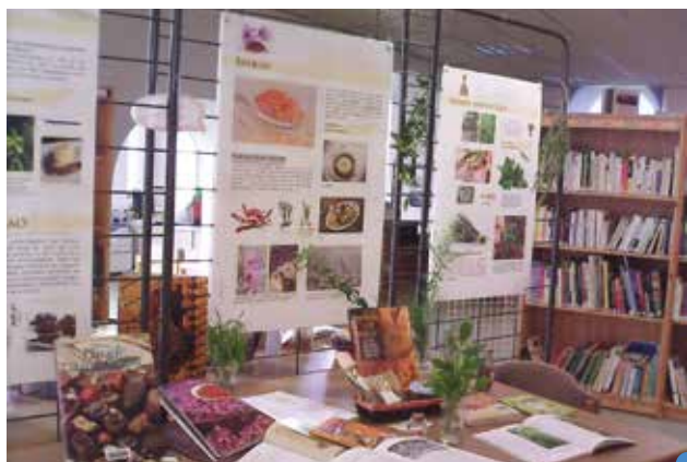
exposition sur les épices à la Médiathèque

Chacun a pu découvrir ou redécouvrir des épices et herbes aromatiques par la vue et par l'odeur, trouver des recettes culinaires et apprendre l'histoire de ces produits.