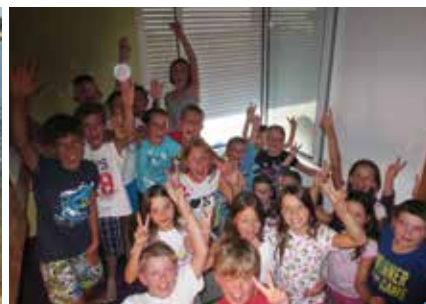
mini-camp au Lac du Der