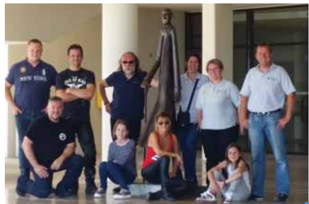
les Pistons Champenois et le «Grand Charles»

site internet www.lespistonschampenois.e-monsite.com