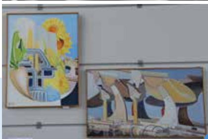
Art et Industrie se sont cotoyés pour ces Journées du Patrimoine 2015 en bas à gauche: les élus en présence de M. Savy, Préfet de région