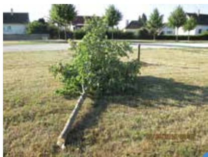
arbre arraché dans les Avenues

Une plainte a été déposée à la brigade de Gendarmerie de Montmirail.