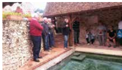
visite guidée du lavoir de Fontaine-au-Bron