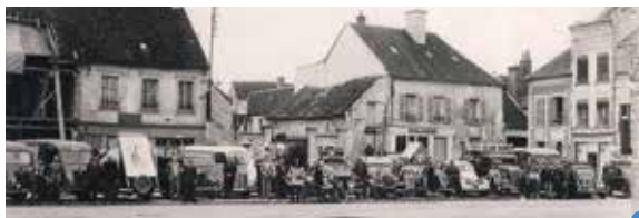
place Rémy Petit