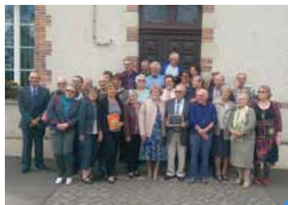
photo de classe 2015

Une fois n'est pas coutume, les élèves ont attendu le départ de leurs instituteurs pour quitter l'école après cette journée forte en émotions.