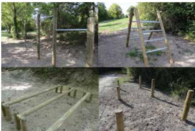
des exercices d'équilibre, de tractions,... vous attendent

L'installation de ces 9 éléments par les services techniques de la mairie a coûté 3 500 € HT.