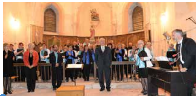
les deux chorales réunies

Enfin, les deux chorales ont uni leurs voix sous la direction de chacun des chefs pour interpréter un chant orthodoxe « Te bie Poem » et un titre très connu du public « La tendresse » de BOURVIL.