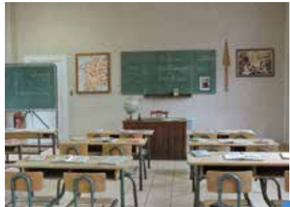
reconstitution de la salle de classe des années 1960

Ce 20 septembre 2015 restera gravé dans la mémoire des anciens élèves de l'école intercommunale de Rieux-Montenils.