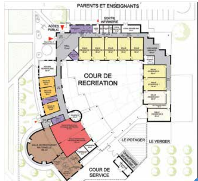
plan de la future école maternelle (projet)

L'école maternelle sera implantée sur le terrain jouxtant l'hôpital Rémy Petit Lemerrier.