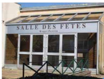
la salle des fêtes Roger Perrin

MJC/ELC · Histoire et Patrimoine entre Brie et Champagne