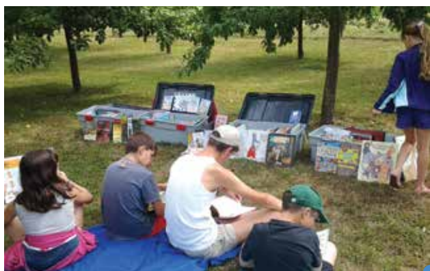
« lire en short » à Bergères-sous-Montmirail

Au Thout-Trosnay, au Gault-Soigny, à Fromentières, à Bergères-sous-Montmirail, à Montmirail, enfants et adultes ont pu profiter de la manifestation « Lire en short » organisée par la Médiathèque intercommunale pour se plonger dans un livre du fonds de la Médiathèque et se projeter dans l'imaginaire.