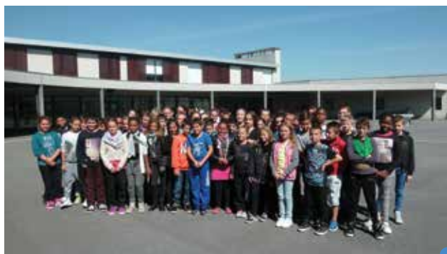
les 6 e , promotion 2015/2016

Deux grands chantiers s'annoncent pour les mois à venir : la préparation de la mise en place de la Réforme du Collège et l'instauration du « Parcours d'Avenir » des élèves pour répondre